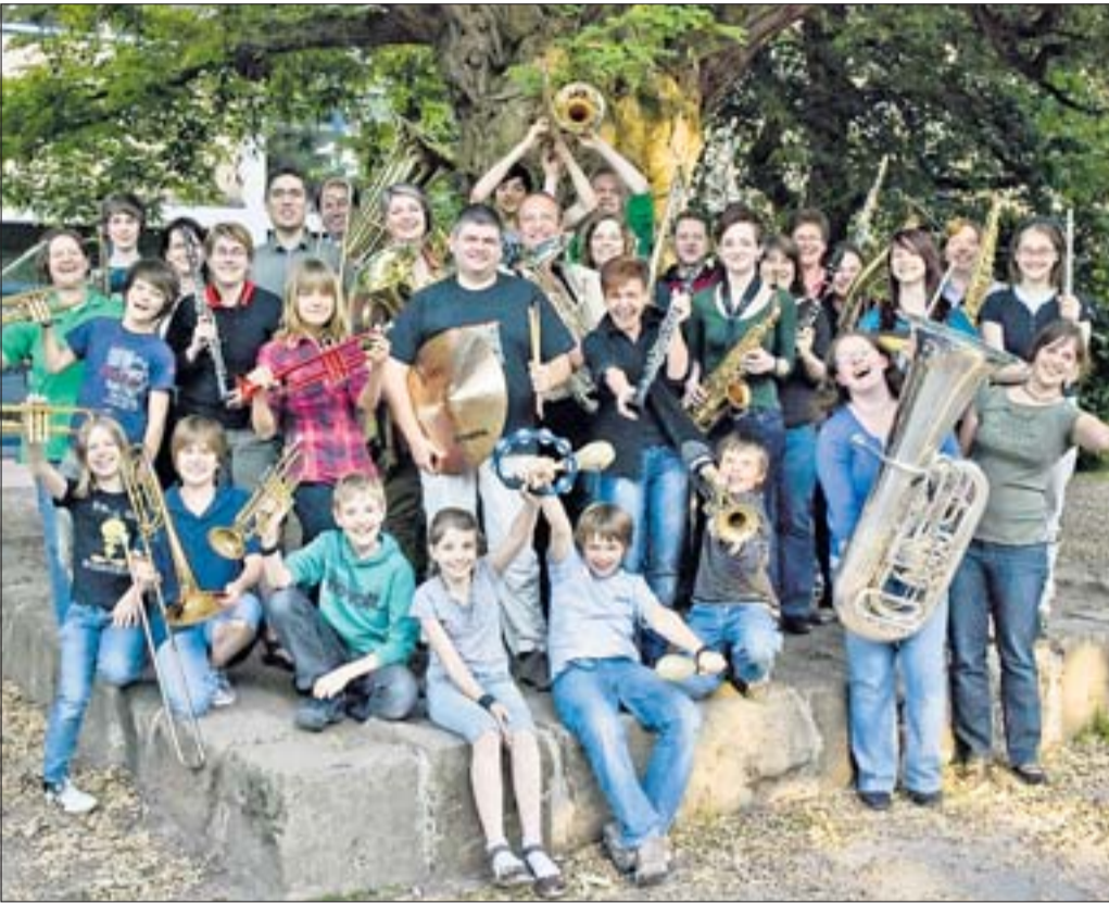
Suchen noch Mitspieler aller Alters- und Ausbildungsstufen: Das neu formierte sinfonische Blasorchester „ohne Geigen“.

Monatliche Beilage des Hannoverschen Wochenblattes für den Stadtteil Ricklingen N° 103